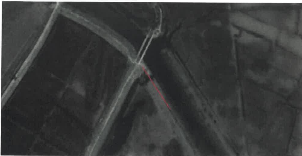
Slika 1: lokacija izgradnje nasipa